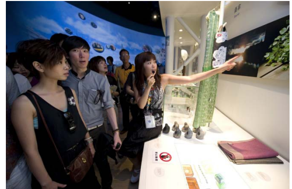
Kirnun erinomaiset oppaat kertoivat suomalaisesta elämästä, muotoilusta ja esineiden taustoista.