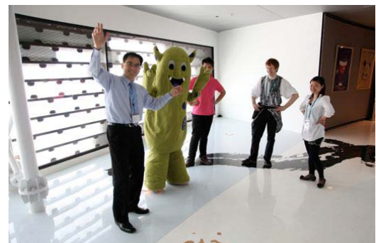
Helsingin matkailun maskotti Helppi vieraili Kirnun VIP tiloissa

Helsingin seutu on ihmisläheinen ja samalla vilkas metropoli, jossa yhdistyvät idän ja lännen vaikutteet. Meren läheisyys mahdollistaa monia aktiviteetteja ja lukuisat puistot ja viheralueet tarjoavat ainutlaatuiset puitteet rentoutumiselle ympäri vuoden. Helsinki on tärkeä Itämeren risteilykohde ja maailmanluokan kongressikaupunki. Pääkaupunkiseudulla on