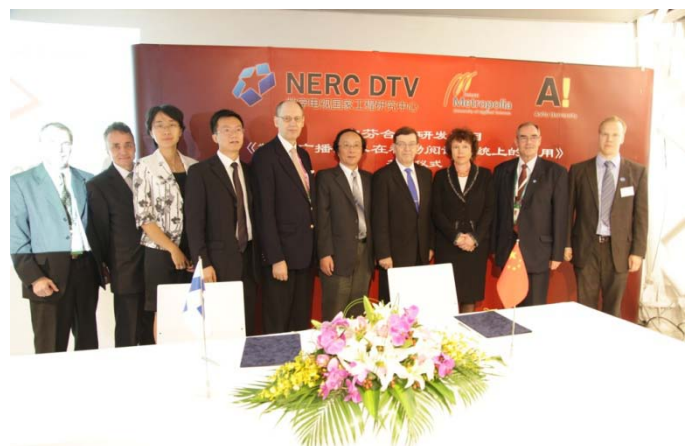
Aalto yliopiston, Metropolian, NERC DTV:n ja Jiaotong yliopiston aiesopimuksen allekirjoitustilaisuus Innovaatiopäivien aikana.

Tavoitteena on kehittää uusi, kustannustehokas tiedonjakelualusta ja palvelukonsepti laajoille maantieteellisille alueille hajautuneen väestön tiedonsaannin tarpeisiin. Kohteina ovat erityisesti suuri maaseutuväestö Kiinassa samoin kuin kehittyvät markkinat globaalisti.