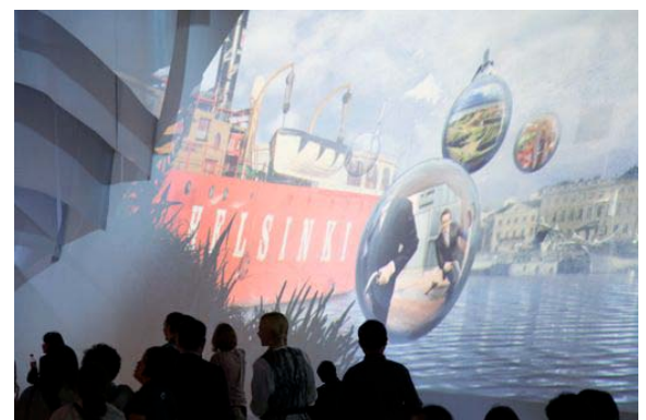
Monimediaseinä esitti kuvia dynaamisesta pääkaupunkiseudusta.