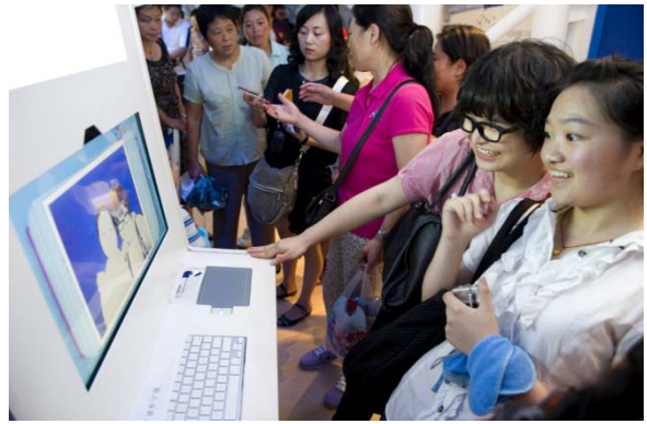
Digitaaliseen vieraskirjaan, Helsinki Guestbookiin, jätettiin 100 815 viestiä ja kuvaa.

Kolmannen kerroksen VIP-vieraat pääsivät tutustumaan innovaatiosovelluksiin Living Labs Demo -huoneessa ja jättämään terveisensä Helsingin digitaaliseen vieraskirjaan.