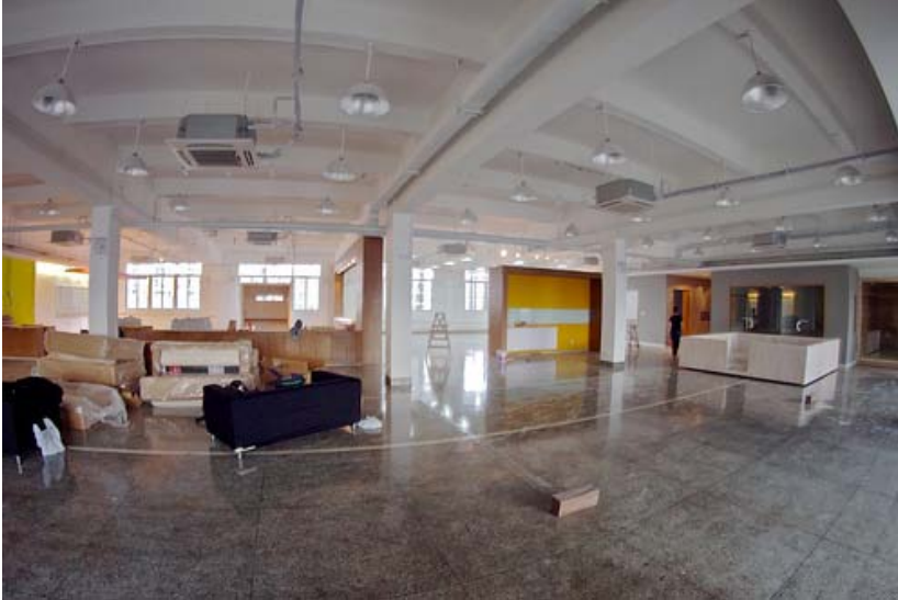
Aalto Tongji Design Factory muutama päivä ennen avajaisia.