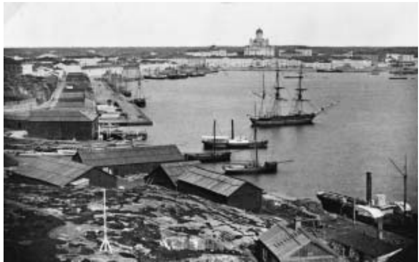
Näkymä Kalliorannan huvilasta Eteläsatamaan yli Makasiinirannan. Eugen Hoffers 1860-luku. Helsingin kaupunginmuseum.

Under 1800-talet blev Helsingfors Finlands största industriort. Produktionen av traditionella konsumtionsvaror fick vid seklets mitt sällskap av maskinindustrin. De allt bättre kommunikationerna till inlandet och utlandet främjade denna utveckling. Uppsvinget tog sig också uttryck i ökat byggande på 1870-talet. Stads kärnan, som tidigare bestått främst av trähus, förvandlades till en stenhusstad i nyrenässansstil. År 1875 hade Helsingfors 31 000 invånare.