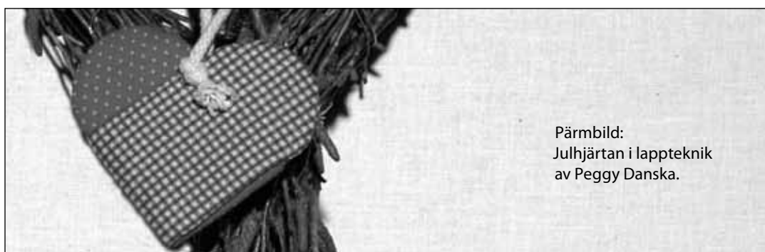
Pärbild: Julhjärtan i lappteknik av Peggy Danska.

Arbis tackar alla som bidragit till ett lyckat loppisresultat – både ni som köpt och ni som givit! Idag, på svenska dagen, står saldot på 682,85 €. Pengarna kommer främst att användas för en gemensam julfest för våra 223 timlärare och övrig personal. Detta bidrar till det vi kallar ”arbisandan”, dvs ger våra timlärare en möjlighet att träffas i huset under mera lättsamma rutiner än de är vana vid. Oftast träffas bara de lärare som har undervisning under samma tid varandra medan man inte alls känner andra timlärare eller övrig personal. Vi är tacksamma för ert stöd!