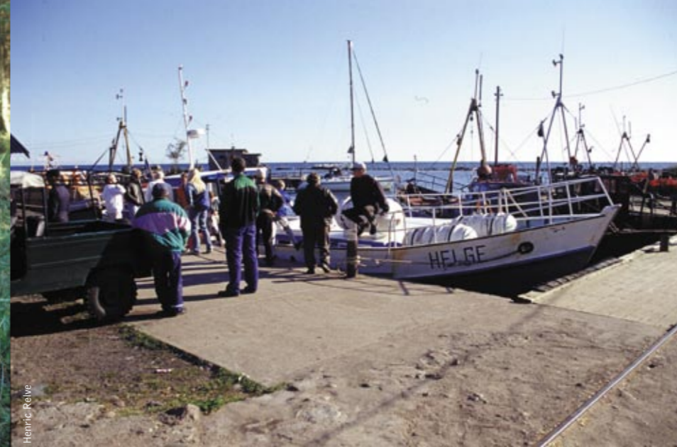
Postiveneen lähtöpaikka Pranglilla.