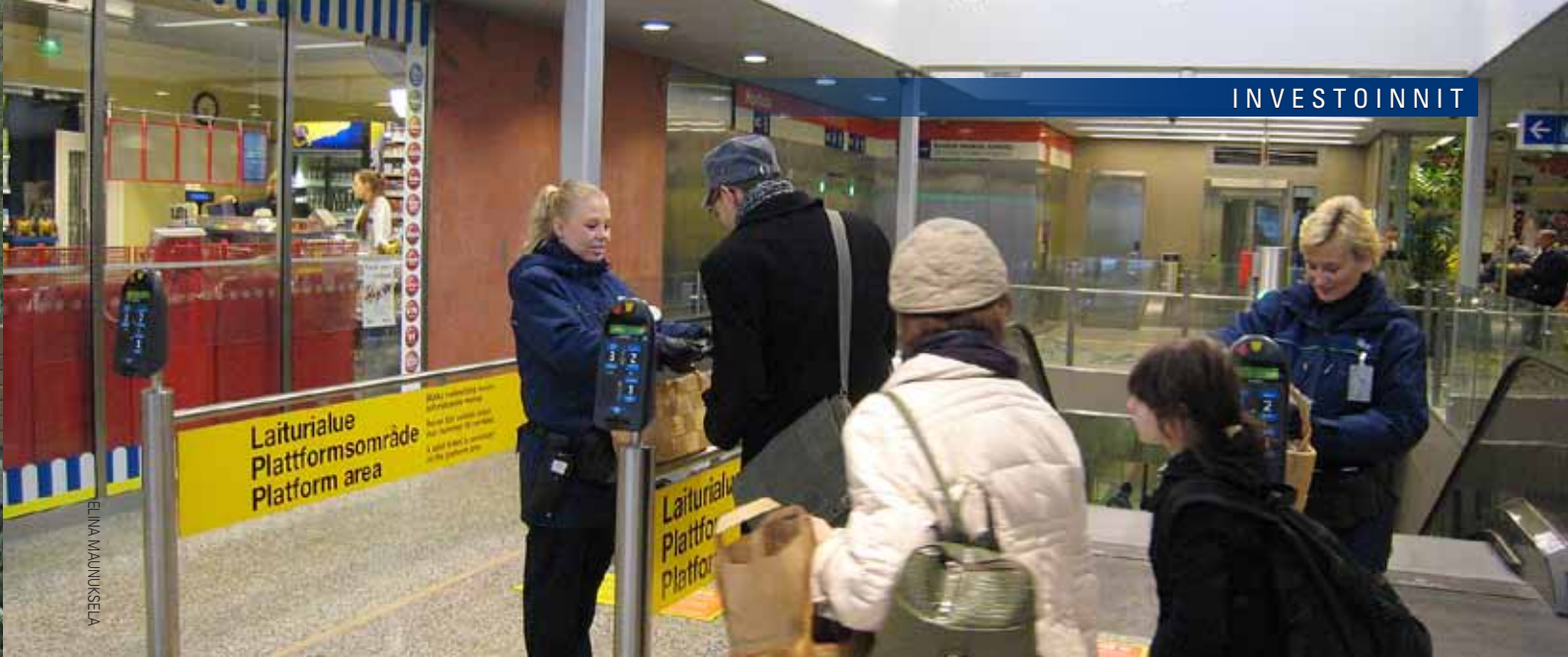
HKL:n matkalipuntarkastajat lippuja tarkastamassa Kontulan metroaseman uudella sisäänkäynnillä.

kuntapuiston (Vuosaaren puro) esirakentaminen 1,2 milj. euroa.