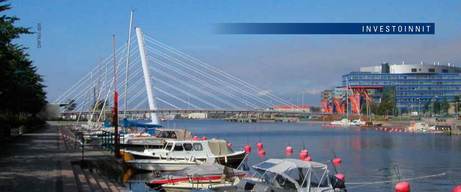
Crusellin sillan rakentaminen alkoi vuonna 2008

melusteiden rakentaminen eivät edenneet tiehallinnon riittämättömän rahoituksen takia.