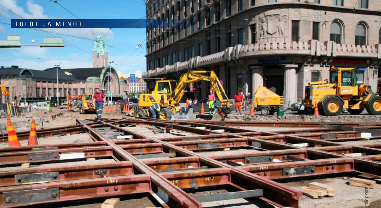
Kampin raitiotien rakentamista Kaivokadun ja Mannerheimintien risteyksessä heinäkuussa 2008.

Toimintamenoja ja toimintatuloja ovat talousarviovuoden juoksevasta palvelu- ja muusta toiminnasta aiheutuvat menot ja siitä saatavat tulot.