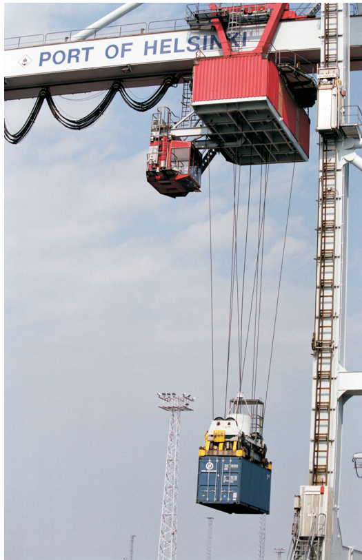
Konttinosuri Helsingin satamassa