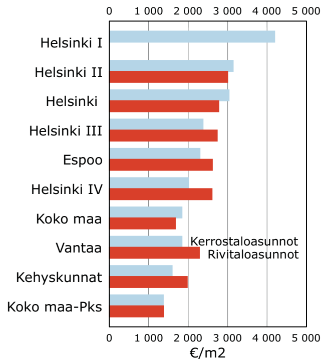
Kuvio 3. Asuntojen neliöhinnat talotyyppin mukaan Helsingissä ja vertailu-alueilla huhti–kesäkuussa 2006