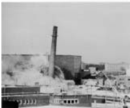
Foto: Byholmens avfallsbränningsverks skorsten fälls år 1988.

Före Andra världskriget var förbättrandet av levnasförhållandena den viktigaste betoningen i hälsovårdsfrågan, och det fanns inte möj-